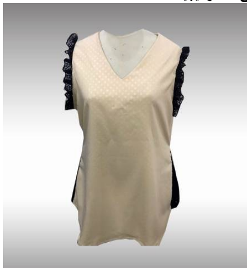
شكل (2) موديل بلوزة بمرد منفذ قبل تطبيق الاستراتيجية