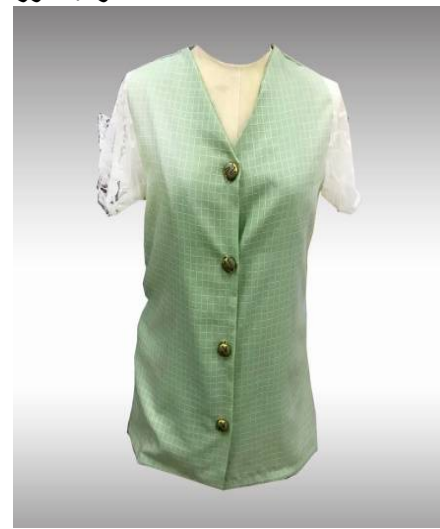
شكل (1) موديل بلوزة بمرد منفذ قبل تطبيق الاستراتيجية