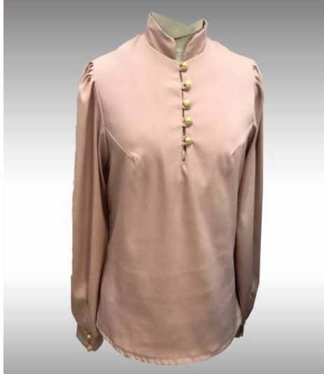
شكل (6) موديل بلوزة منفذ بعد تطبيق الاستراتيجية

ثانيا : صور الموديلات بعد تطبيق الاستراتيجية