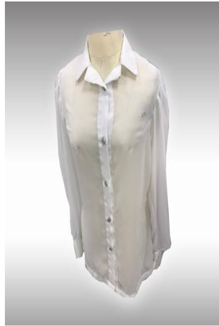
شكل (9) موديل بلوزة بمرد منفذ بعد تطبيق الاستراتيجية ترتيب التصميمات ونسب تحقيقها للمحاور :

جدول (3) يوضح درجات التصميمات و ترتيبها ونسبة تحقيقها للمحاور