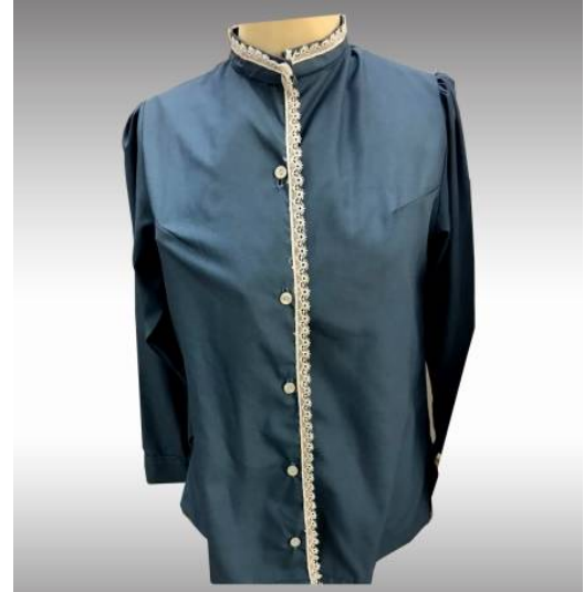
شكل (5) موديل بلوزة بمرم منفذ بعد تطبيق الاستراتيجية