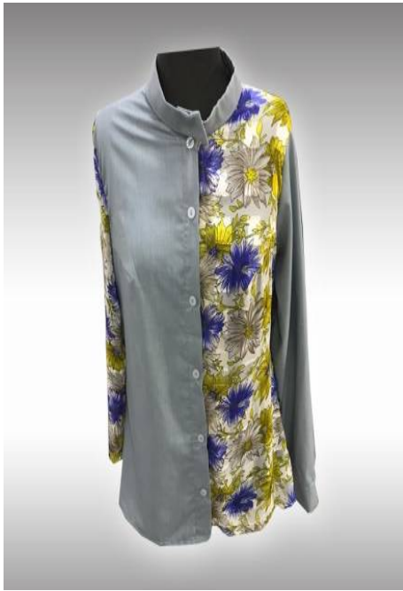
شكل (10) موديل بلوزة بمرد منفذ بعد تطبيق الاستراتيجية