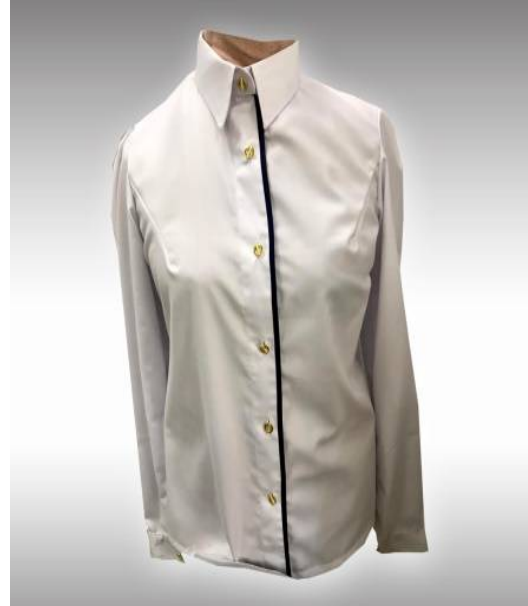
شكل (3) موديل بلوزة بمرم منفذ قبل تطبيق الاستراتيجية

ثانيا : صور الموديلات بعد تطبيق الاستراتيجية