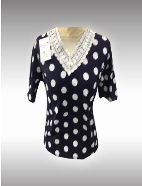
شكل (4) موديل بلوزة بفتحة رقية على شكل حرف V منفذ قبل تطبيق الاستراتيجية