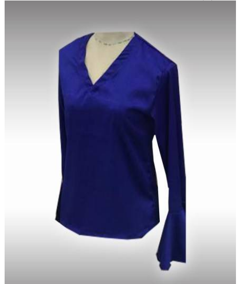
شكل (8) موديل بلوزة منفذ بعد تطبيق الاستراتيجية