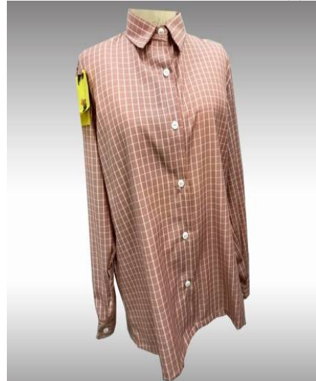
شكل (7) موديل بلوزة بمرم منفذ بعد تطبيق الاستراتيجية